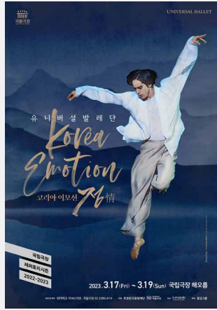
코리아 이모션 Korea Emotion 情